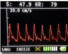
Hız dalga formu