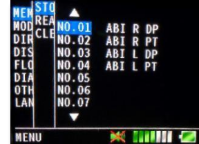
30 dalga formu Menüsü